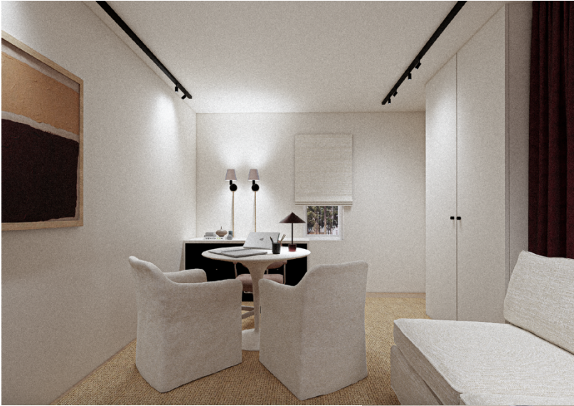
Novapsy Bureau consultation