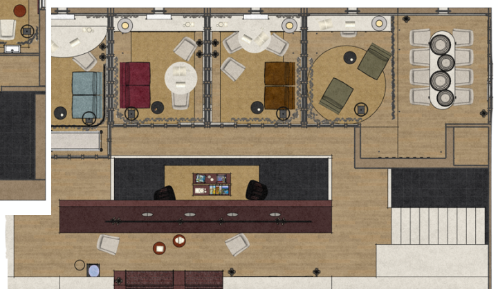
Novapsy – Étage