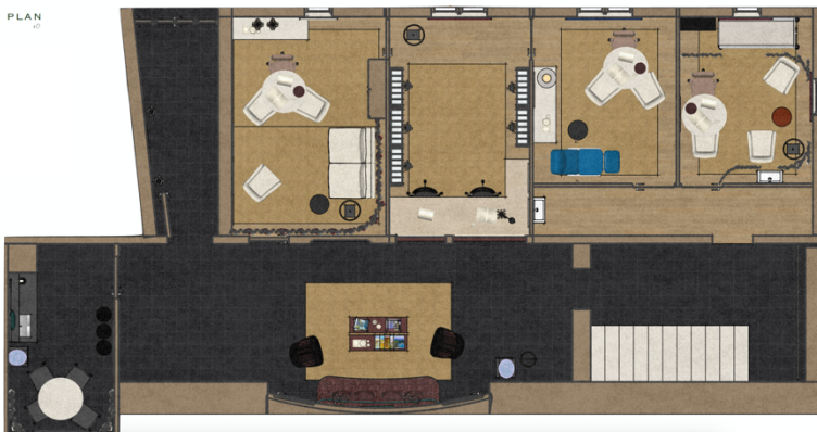
Novapsy – Rez-de-chaussée