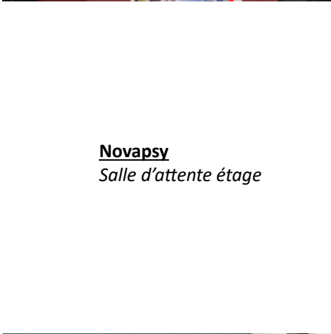
Novapsy Salle d'attente étage