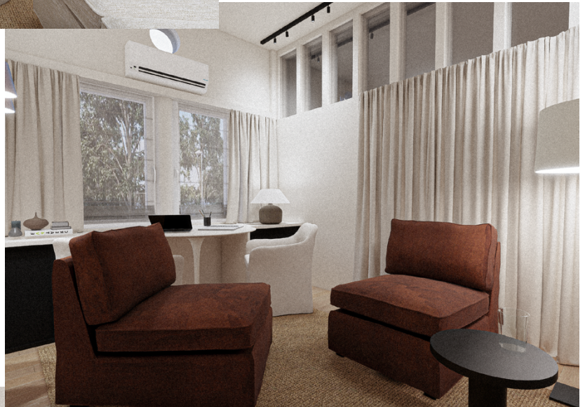
Novapsy Bureau consultation