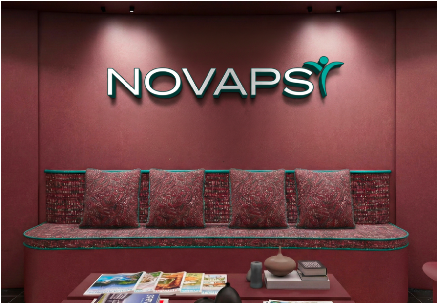
Novapsy Salle d'attente principale