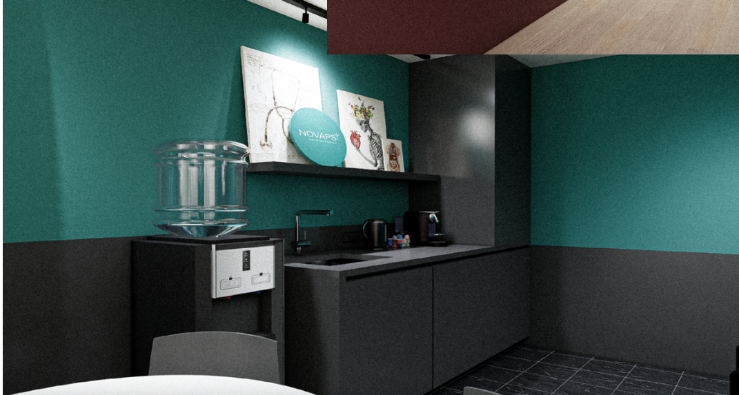
Novapsy Coin repas